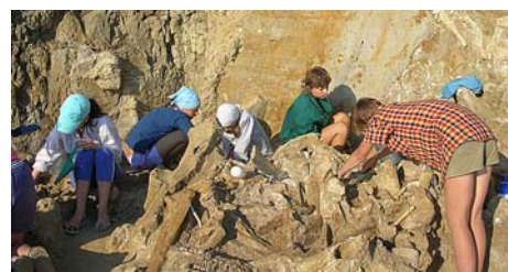
Раскопки массового захоронения древних слонов и носорогов на Таманском полуострове

В отделе инновационных проектов Дворца творчества начинается работа уникальное объединение «Юный палеонтолог», здесь ребята могут узнать о вымерших обитателях Приазовья, древнейшей исто-